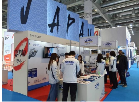
右: ジャパンパビリオンの様子(ホール 2.1)