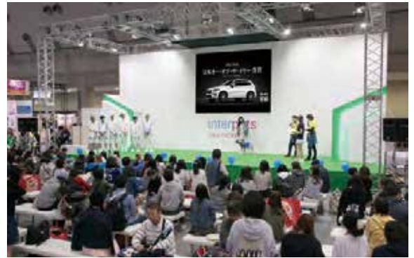
特設ステージCM放映イメージ