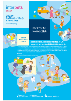
オフィシャルフェアガイドイメージ