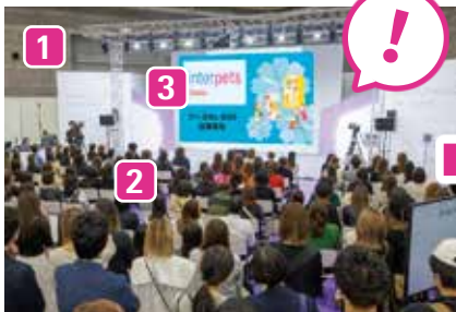
小間番号の表示でブース来訪率のUP