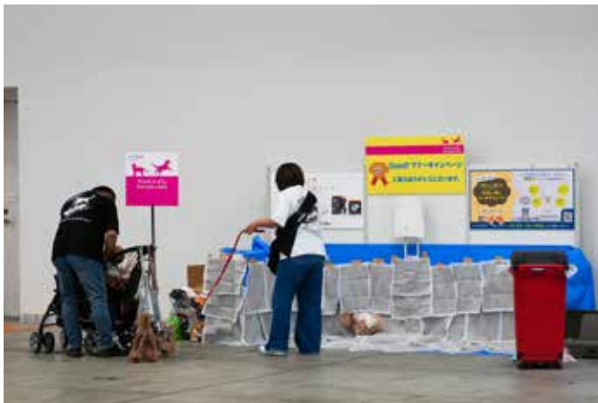
例1: 貴社アイテムの使用感を来場者に試していただけます。