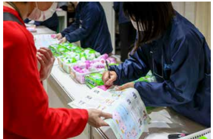
例:アンケート回収時に貴社協賛品をお渡します。