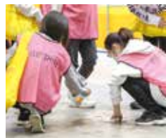
5. 学生ボランティア (P.6)