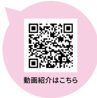
動画紹介はこちら