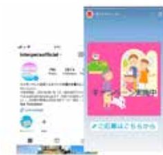
12. 公式Instagram広告 (P.12)