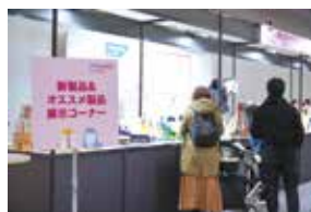
3. 新製品・オススメ製品コーナー (P.4)