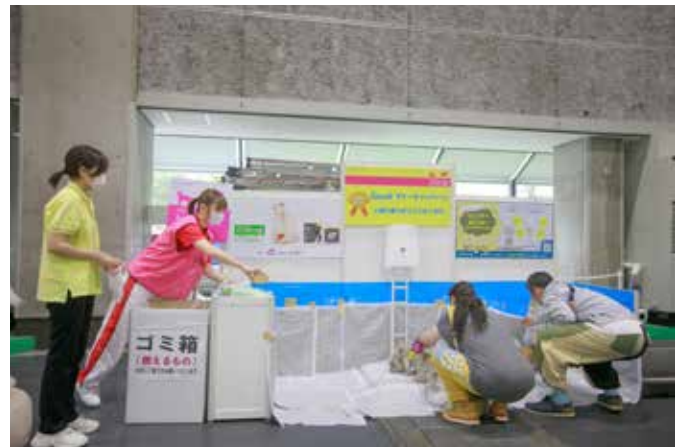
例2: スタッフが定期的にペットトイレを清掃いたします。