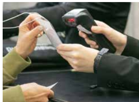
リーダー利用イメージ