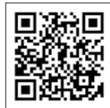
「セキュアバーコード® リーダー3rd」紹介動画

貴社ブースに来訪した来場者のバッジQRコードをスキャンすることで、主催者が集計したアンケート回答と名刺情報を会期後7営業日以内にエクセル形式にて入手できます。会期後の名刺リスト化を省略したり、名刺をお持ちでない来場者のデータを入手するなど、大きな効果が得られます。詳細は上記QRコードより紹介動画をご覧ください。