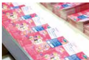
1. オフィシャルフェアガイド広告 (P.2)