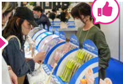
ブース来訪者との商談チャンス!