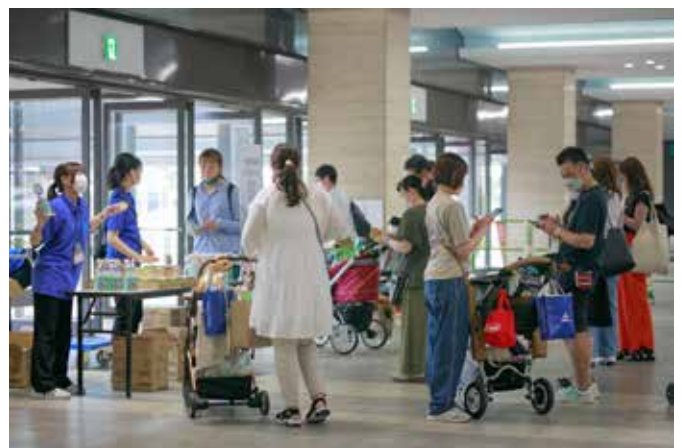
例:試用いただきたいアイテムがありましたら最適です。