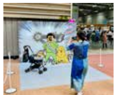
8. 写真撮影スポット (P.9)