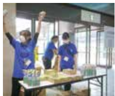
6. 来場者アンケート (P.7)