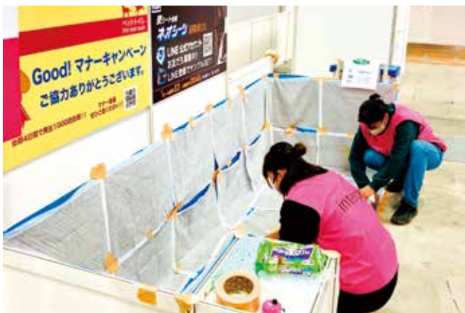
例2: ペットトイレで消臭剤を使用したりします。