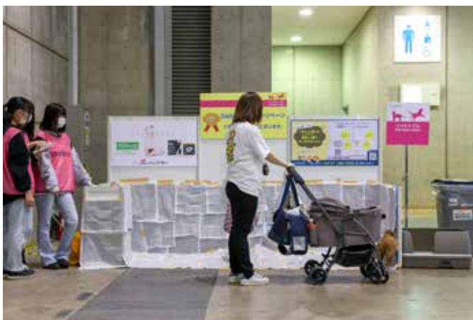
例3: 貴社広告ボードを壁に設置いたします。