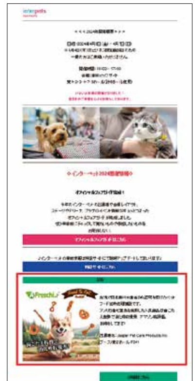
来場誘致メールイメージ