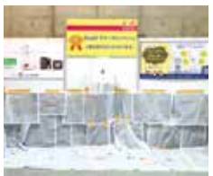
7. ペットトイレ (P.8)