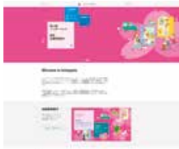
10. 公式ウェブサイトバナー (P.11)