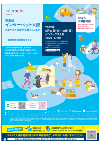
一般来場のご案内イメージ