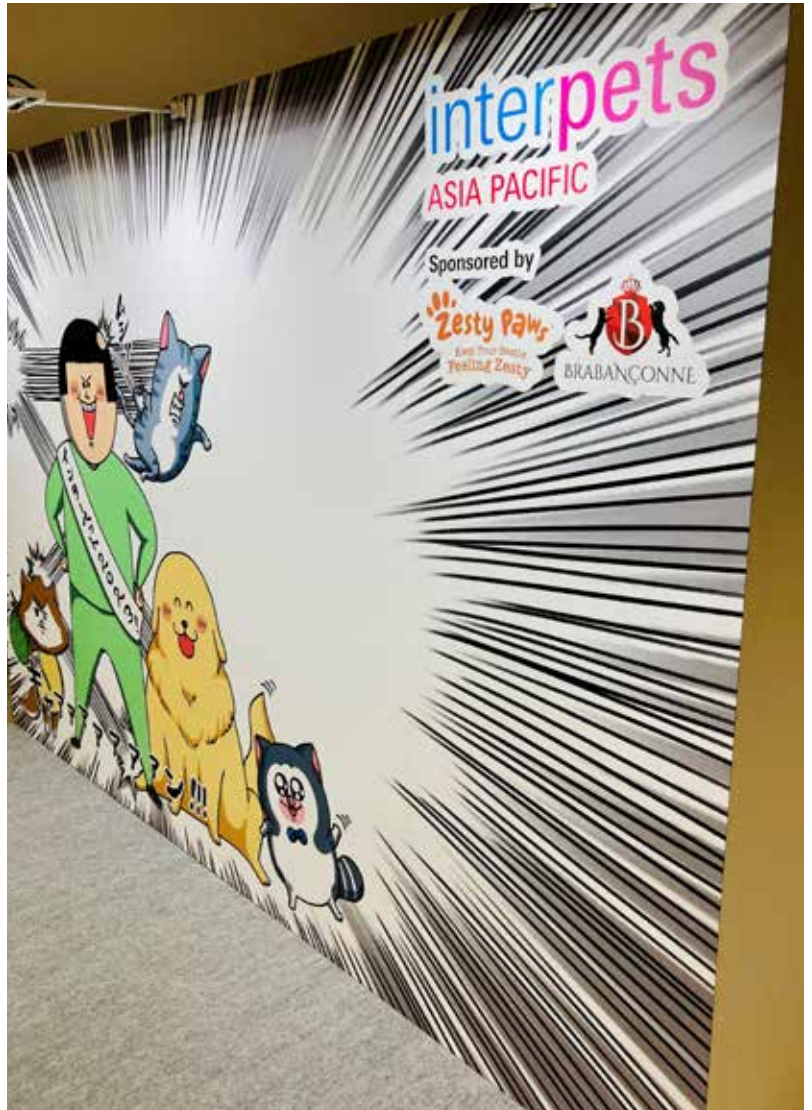
行列になるほどの大人気スポット!