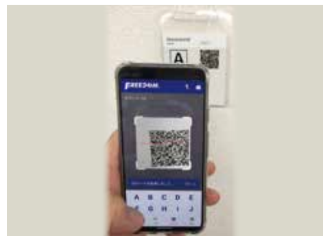
スマートフォンイメージ

申込み 申込は以下のリンクよりお願いいたします。 申込 URL https://regist.securebarcode.jp/