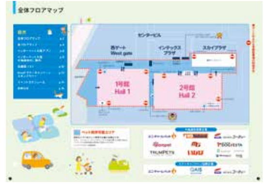
オフィシャルフェアガイドイメージ