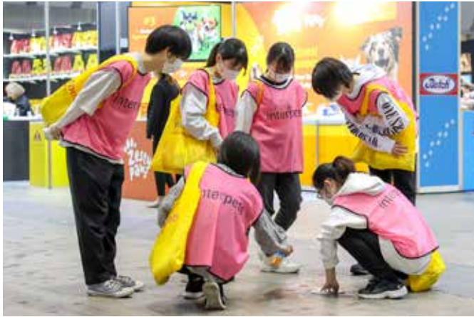
例1: 会場内床そうじに貴社アイテムを使用いたします。