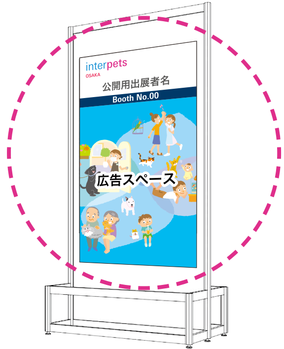
広告ボードイメージ