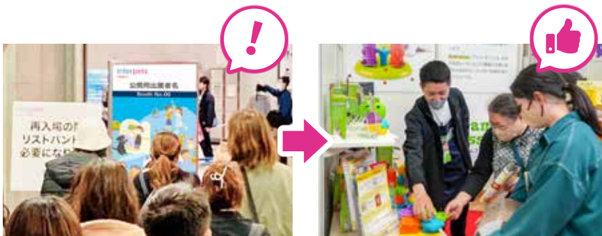
小間番号の表示でブース来訪率のUP