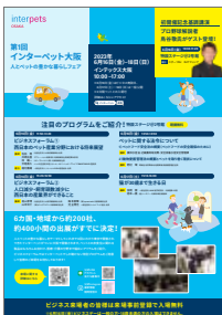
ビジネス来場のご案内イメージ