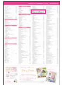
出展者一覧へのロゴ掲載