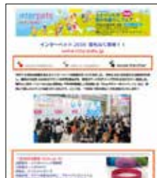
11. メール配信 記事広告/ロゴ広告 (P.11)