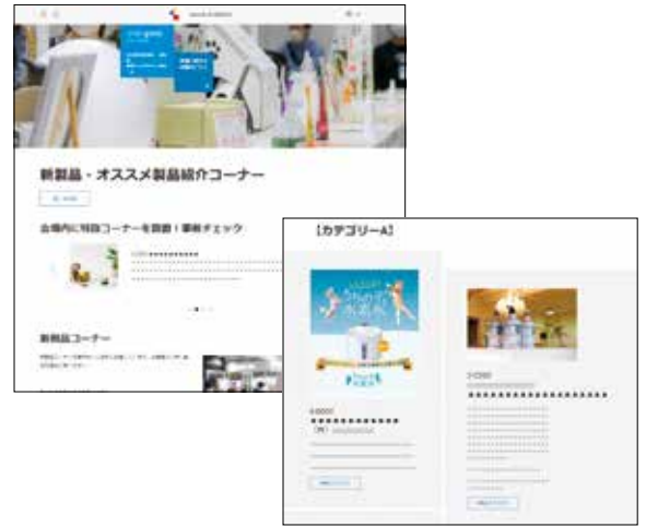
特設ページイメージ