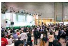
2. 特設ステージでの動画CM放映権 (P.3)